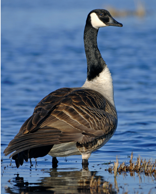
In Deutschland fühlen sich zunehmend eingewanderte Gänse wohl, z. B. die Kanadagänse (im Bild) oder die Nilgänse.

bereits im alten Rom als Schutz vor Dieben und Einbrechern gehalten.